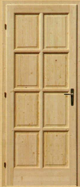
90/210 tele "M8"