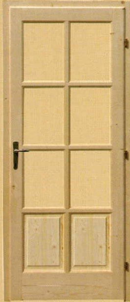
90/210 félig üvegezhető "M8"