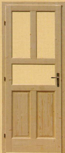
90/210 félig üvegezhető "M5"