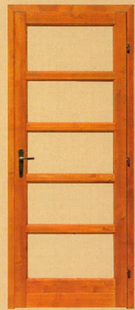
90/210 üvegezhető "E5"