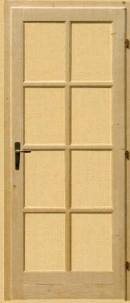
90/210 üvegezhető "M8"