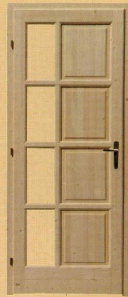
90/210 félig üvegezhető "H8"