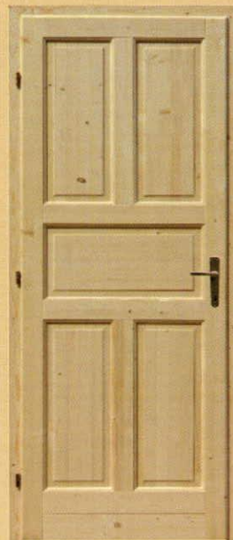
90/210 tele "M5"