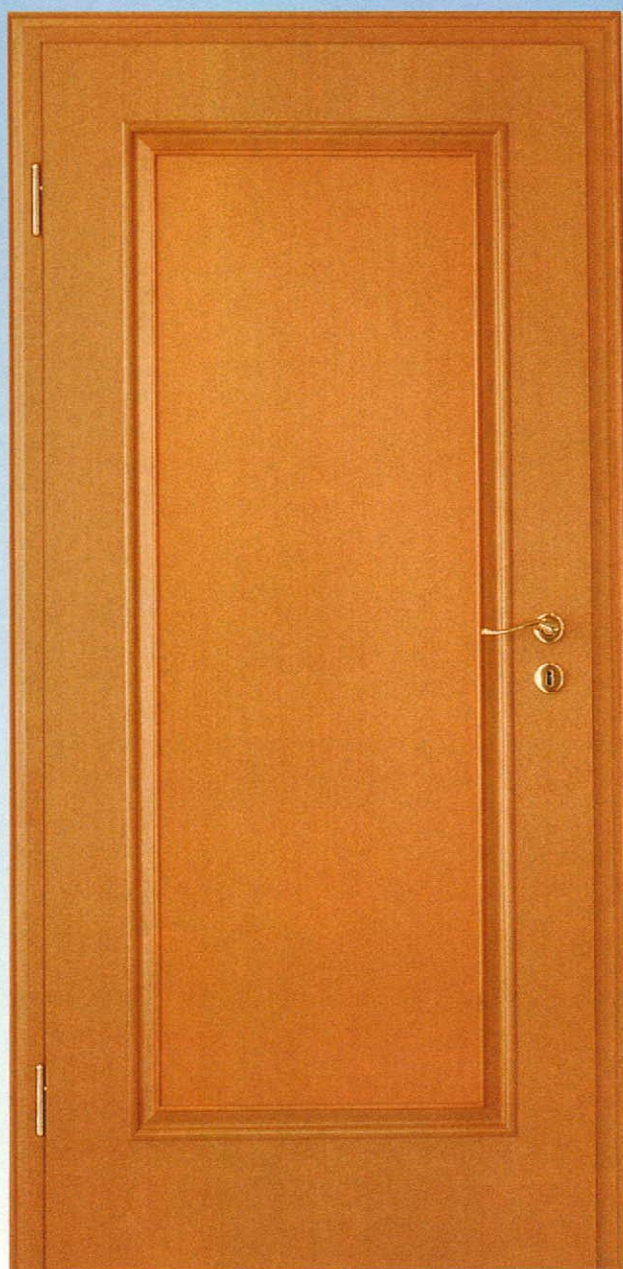
Modell: 11 B