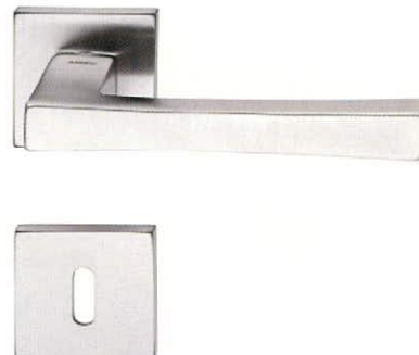
TELIS matt króm

ALAPANYAG: réz | FELÜLET: fényes króm MÉRETEK: A=137 mm D=50 mm | a mellékelt ábrát lásd a lap alján