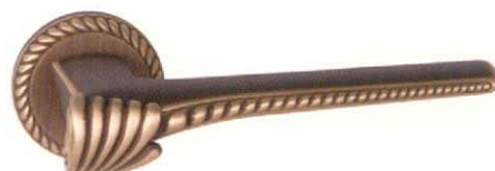
CHORA matt bronz

ALAPANYAG: réz | FELÜLET: matt bronz MÉRETEK: A=135 mm D=51 mm | a mellékelt ábrát lásd a lap alján