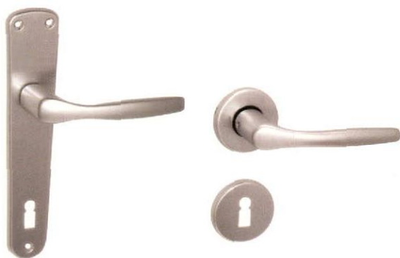
CHRISTIE alu F1

ALAPANYAG: alumínium | FELÜLET: ezüst színre eloxált MÉRETEK: A=121 mm B=205 mm C=32 mm D=52 mm | a mellékelt ábrát lásd a lap alján