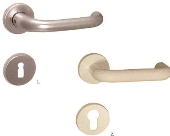
1. URSULA alu F1 2. URSULA műanyag

ALAPANYAG: 1. alumínium 2. műanyag | FELÜLET: 1. ezüst színre eloxált 2. fehér raktárról más színek megrendelésre | MÉRETEK: 1. A=130 mm D=52 mm 2. A=126 mm D=50 mm