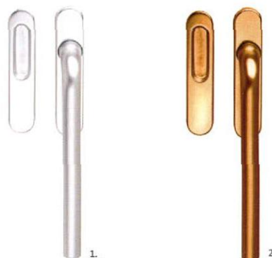
1. 18000 ALU F1 emelő-tolóajtó kilíncs grt. 2. 18000 ALU F4 emelő-tolóajtó kilíncs grt.

ALAPANYAG: alumínium | FELÜLET: 1. ezüst színre 2. antik jellegűre eloxált MÉRETEK: A=245 mm B=158 mm C=33 mm