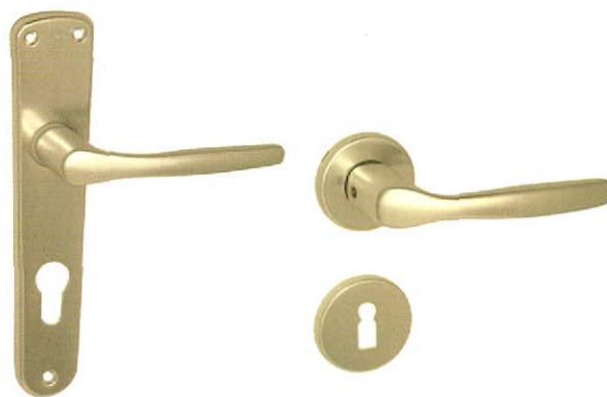
CHRISTIE alu F2

ALAPANYAG: alumínium | FELÜLET: pezsgő színre eloxált MÉRETEK: A=121 mm B=205 mm C=32 mm D=52 mm | a mellékelt ábrát lásd a lap alján