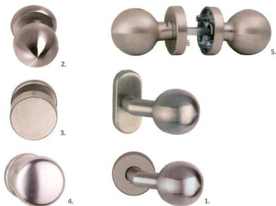
1. ELTOLT GÖMB, inox 2. GÖMB ALAKÚ, inox 3. HENGERES, inox 4. KERÉK GOMB, alu 5. GOMB-GOMB, inox, Tupai

ALAPANYAG: 1-3, 5. rozsdamentes acél 4. alumínium | FELÜLET: 1-3, 5. szálciszított 4. ezüst színre eloxált MÉRETEK: D=50 mm