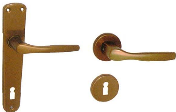
CHRISTIE alu F4

ALAPANYAG: alumínium | FELÜLET: antik színre eloxált MÉRETEK: A=121 mm B=205 mm C=32 mm D=52 mm | a mellékelt ábrát lásd a lap alján