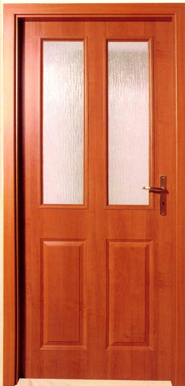
Achilles - éger, jelša, joha, jova

Bela boja – na bazi vode, staklo ornament Dekoracija hrast i bukva, staklo ornament